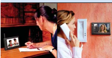
Monitor zum Aufstellen, Aufhängen oder für tragbaren Betrieb

Das DF270 Set ist die komfortable Überwachungslösung für zuhause. Die Bilder der Tag/Nacht-Kamera werden in Echtzeit per digitalem Funk an den portablen 7 Zoll Monitor übertragen. Der integrierte Videospeicher ermöglicht Aufnahmen des Geschehens automatisch bei Bewegung.