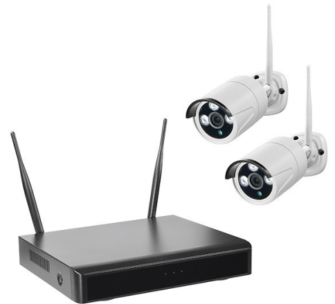
WR100 SET B2 2TB

Kameras der WR100/WR120-Serie, WLAN-Repeater/Access Point WR100E, Antennen-Verlängerungskabel DWAK-3M, DWAK-6M sowie DC-Verlängerungskabel DC10