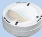
Einfache Anbringung durch Schnellmontage-Klebepad