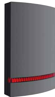
9000AS-AA Abdeckung für Außensirene anthrazit