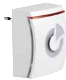
9000IS2 Funk-Innensirene für die Steckdose