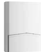
9000IS4 Funk-Innensirene Batteriebetrieb