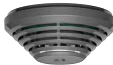
9000SIA Rauchmelder anthrazit