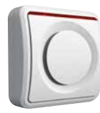
9000IS3 Funk-Innensirene 230 V Betrieb