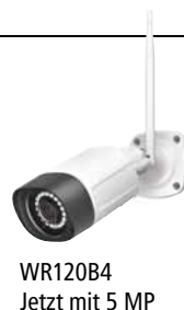
WR120B4 Jetzt mit 5 MP