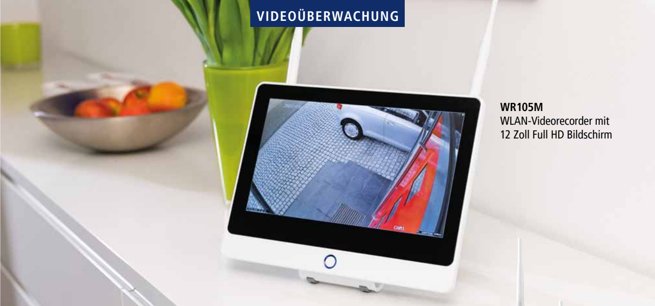
WR105M WLAN-Videorecorder mit 12 Zoll Full HD Bildschirm