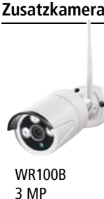
WR100B 3 MP

Livebilder und Aufnahmen auch unterwegs per App