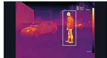
Hybridkamera: 5 MP optischer Sensor plus Thermalsensor